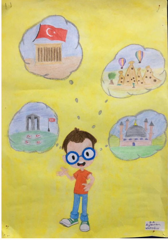
Ayazcan KÖSEOĞLU 4-A