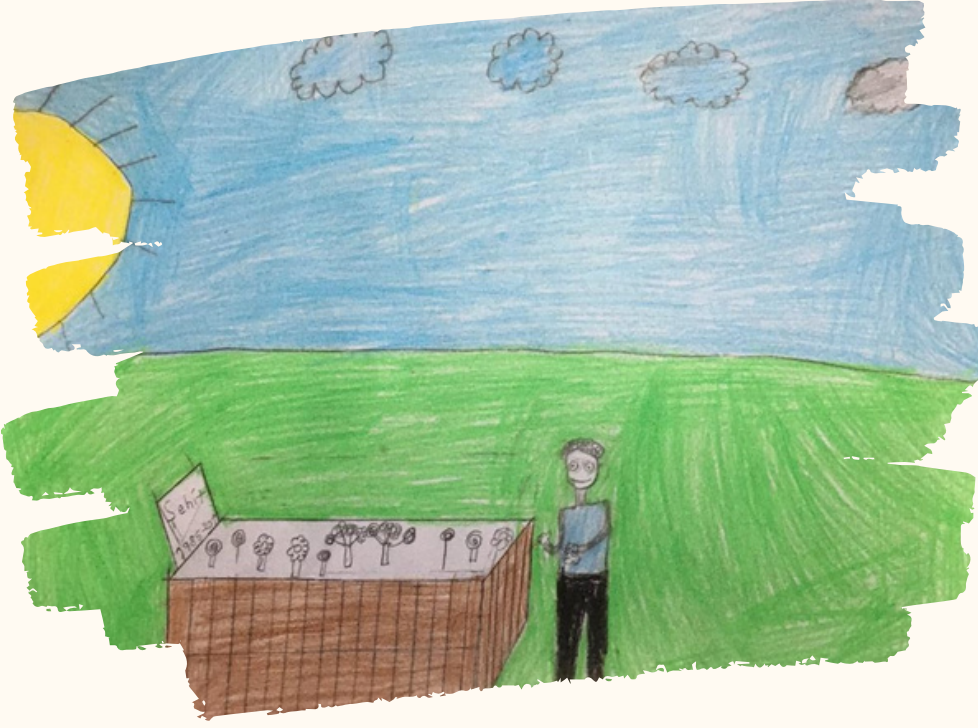
Abdülşamet ÖKTEM 4-C