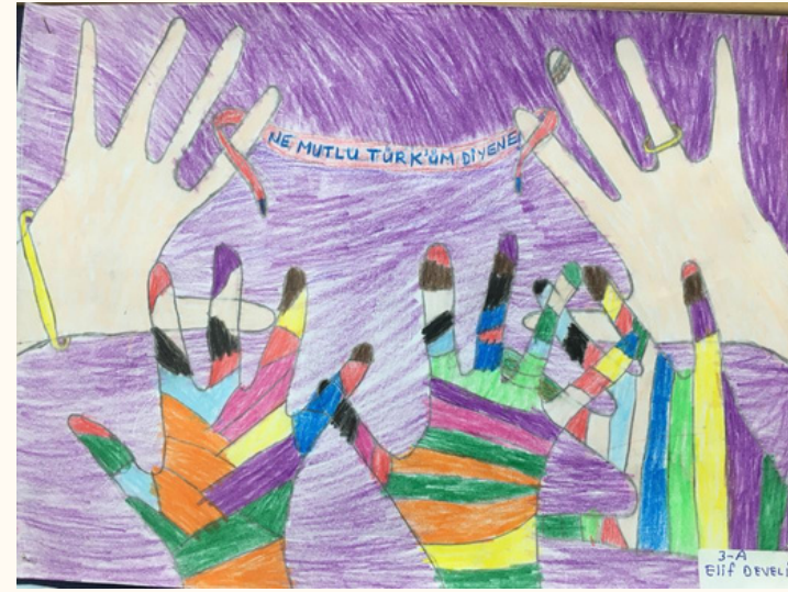
Elif DEVELİ 4-A