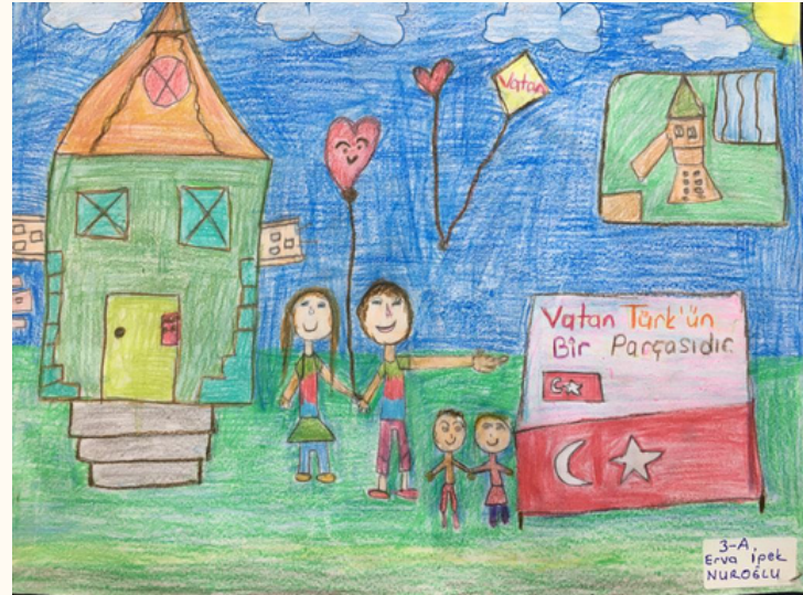
Erva İpek NUROĞLU 4-A